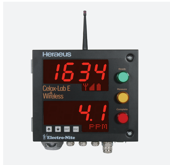
Celox-Lab E Wireless